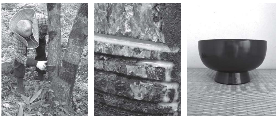
写真3 漆椀 (左および中央、漆掻きの様子 (浄法寺、2014.8.28 撮影)。右、椀。)