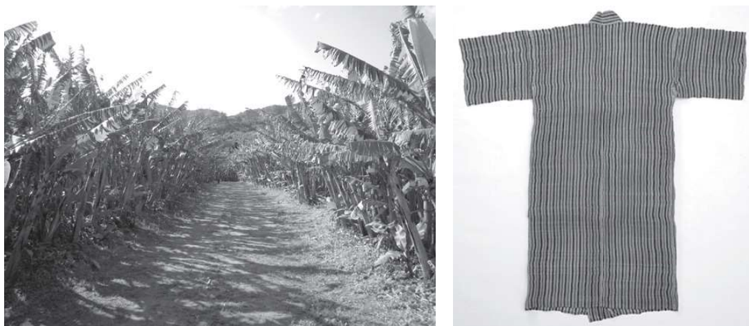
写真2 芭蕉布 (左、糸芭蕉の畑 (2018.3.14 撮影)。右、庶民の着物 。)